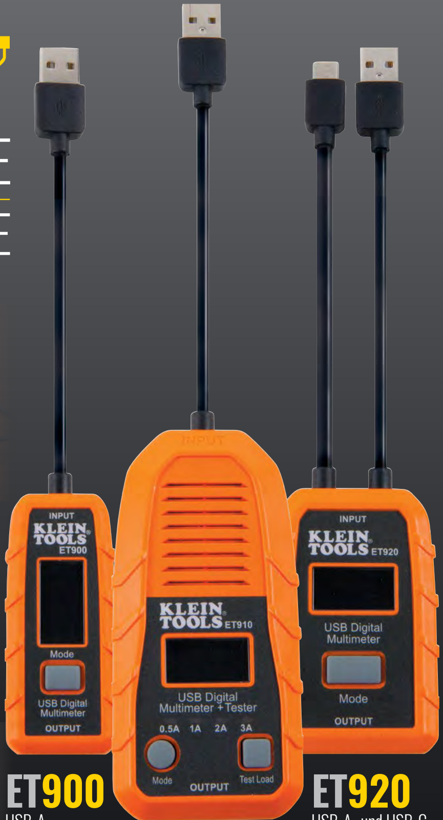
ET900 USB-A- Digitalmessgerät